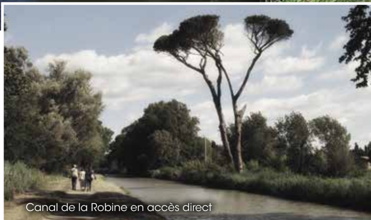
Canal de la Robine en accès direct