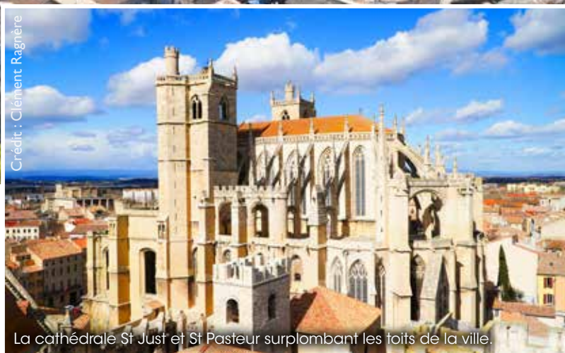
La cathédrale St Just et St Pasteur surplombant les toits de la ville.

Et quand vient la soirée, les terrasses animées des restaurants offrent des moments de partage conviviaux et gourmands.