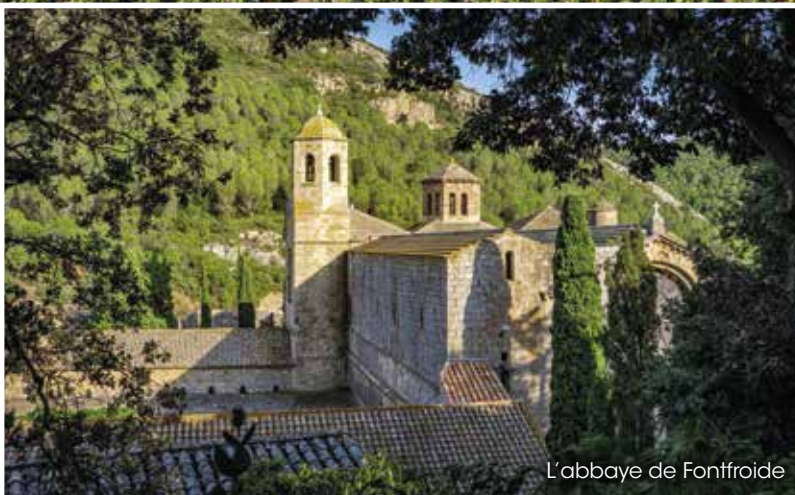
L'abbaye de Fontfroide

Découvrez le massif de la Clape et son cadre bucolique