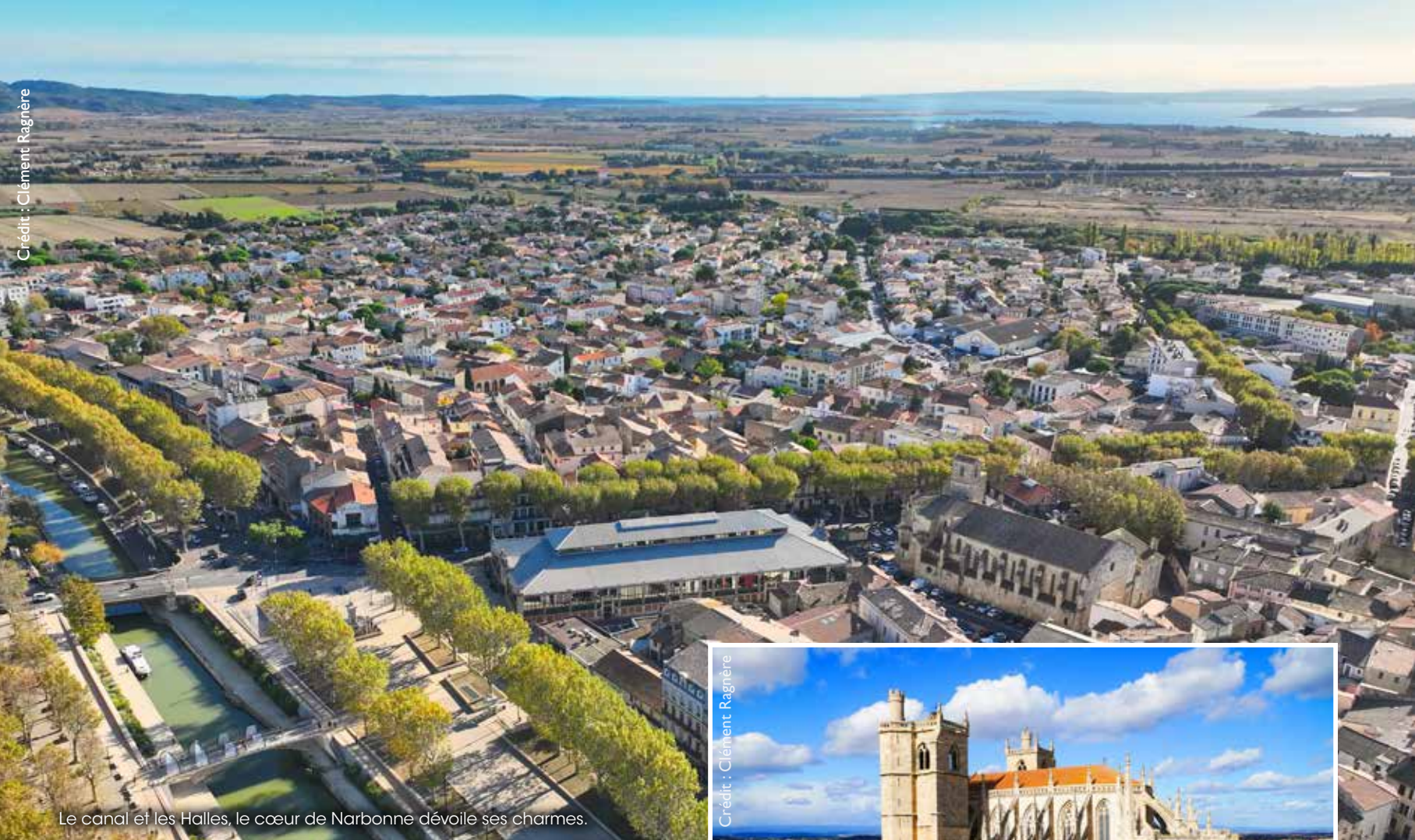
Le canal et les Halles, le cœur de Narbonne dévoile ses charmes.