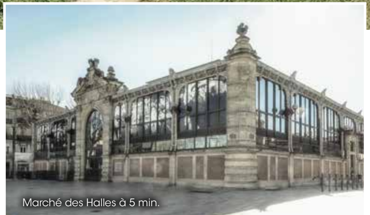
Marché des Halles à 5 min.